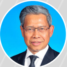
Dato' Sri Mustapa Mohamed Malaysian Minister of International Trade & Industry